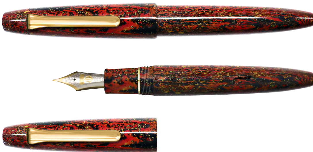
長刀研ぎエボナイト万年筆『紅炎』

本体には「闇の中に燃え上がる炎」をイメージして幾層にも重ねたカラーエボナイト材を採用し、シリアルナンバーを刻んだ特別仕様として、同じものが世界中に二つとない限られた逸品となります。しっとりと手になじむ美しいエボナイト材の感触と唯一無二の長刀研ぎペン先のなめらかな筆記感をお楽しみください。国内 200 本、海外 200 本、世界 400 本限定の販売です。