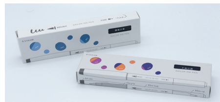
※万年筆用のインクとは成分が異なります

インクボトルやインクカートリッジではなく、ペン型の容器に入るインクの開発『もっとたくさん、いろんな人に万年筆用ボトルインク「インク工房」を楽しんで貰いたい。』という思いから、「万年筆やつけペンを使わなくても書ける」「ボトルよりも少量で持ち運びもできる」インクのかたちを考えました。マーカー型のボディに、ペン先はふでタイプと細字タイプの両頭仕様のペンです。