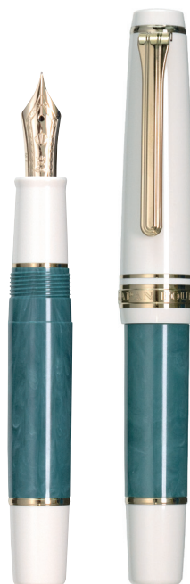
ヴェール サパン (深緑)