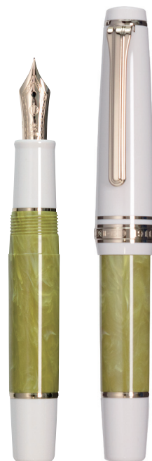
ピスタッシュ (ピスタチオ)