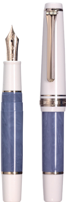
グリシーヌ ヴィオレ (藤)