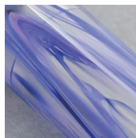
濃淡2色のバイオレットマーブル 国産のアクリル材を使用