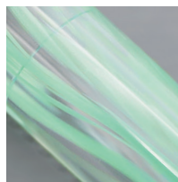
パールが入ったミントグリーンマーブル 国産のアクリル材を使用