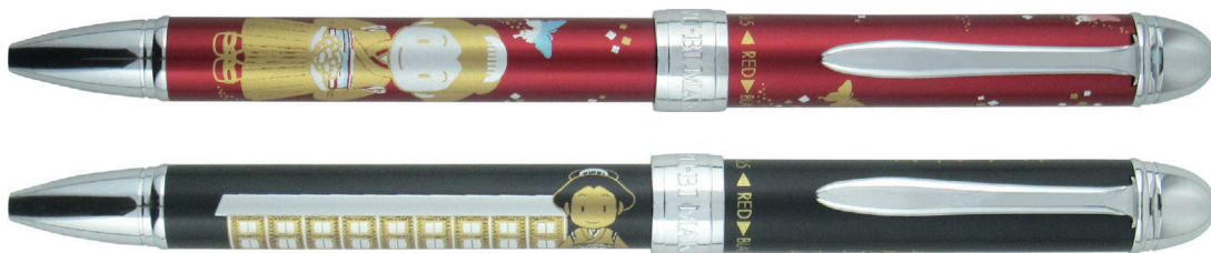
▲優美蒔絵 富岡製糸場