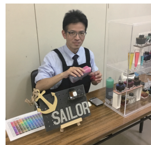
イベントイメージ

※インク工房は有料イベントですので、ご参加いただくお客様にはお一人様 3,850 円（税込）の料金が発生いたします。あらかじめご了承のうえ、お申し込みください。