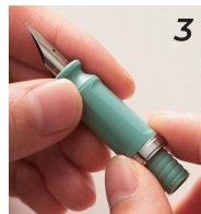
グリップとリングを戻す