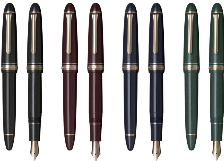
シャイニング ブラック