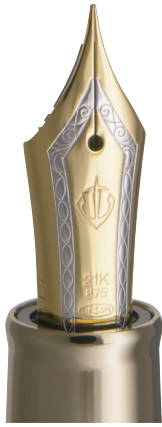
プロフェッショナルギア アンカー ゴールドトリム 万年筆

思考を邪魔せず書き手と一体になるための、しなやかさと鋭さを兼ね備えた新しいボディ形状。構造や素材の特性から表れるシンプルな美しさを目指しました。通常のプロフェッショナルギアタイプよりもやや全長が長く、丸みを抑えたシャープな仕上がり。真鍮素材による重厚感が心地よい緊張感を演出し、金属の持つ力強さと輝きが思考を支えます。