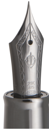
プロフェッショナルギア アンカー ブラックトリム 万年筆