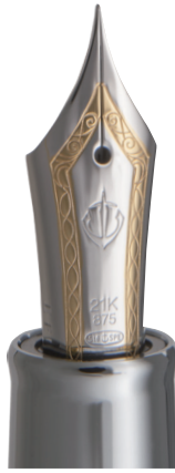
プロフェッショナルギア アンカー シルバートリム 万年筆