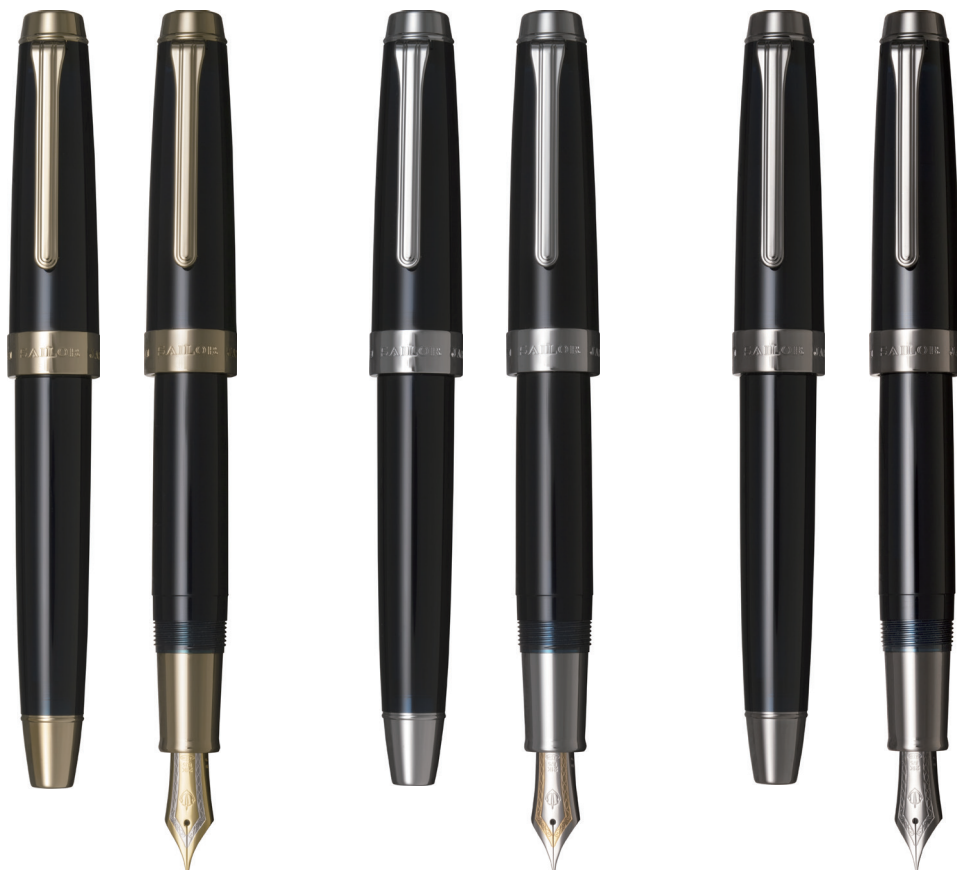
[ ゴールドトリム ]

人生における日常という「航海」の中で、自分の思考を見つめる時間を「錨を下す時」になぞらえ「アンカー」と名付けました。錨は、セーラー万年筆のトレードマークでもあります。「自分の思考と向き合う“時間の質”と“活力”」を提供する万年筆です。