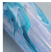
濃淡 2 色のブルーとパープルの ラメ入りマーブル 国産のアクリル材を使用