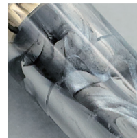
パールが入ったブラックマーブル 国産のアクリル材を使用