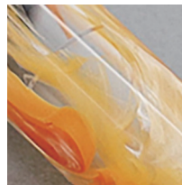
パールが入ったオレンジマーブル 国産のアクリル材を使用